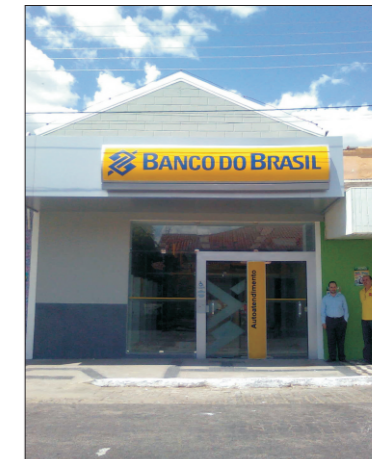
agência de Carnaúba dos Dantas

Eles foram recebidos pelos bancários de Caicó, Currais Novos, Acari, Florânia, Parelhas, Jardim do Seridó, Santa Cruz e Carnaúba dos Dantas, onde o Sindicato constatou a conclusão da nova agência do BB, que será inaugurada em breve. "Já que as novas instalações são bem maiores, esperamos que o posto do BB seja transformado,