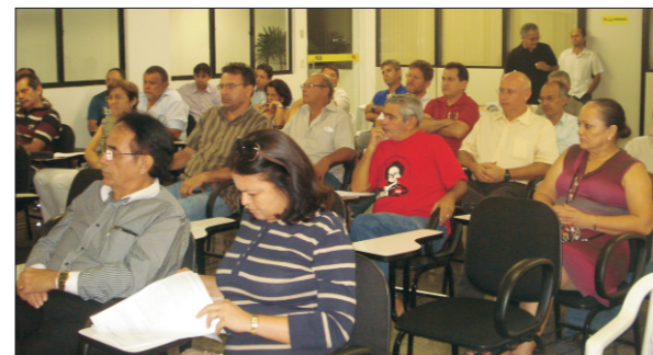
Funcionários da CAIXA tiraram dúvidas sobre ações coletivas

Encontro entre bancários da CAIXA e setor jurídico esclareceu ações coletivas que correm na Justiça