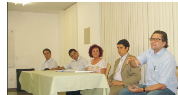
Advogados do Sindicato fizeram histórico dos ataques à base