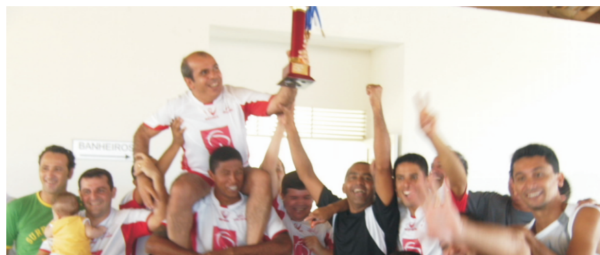
Banco do Brasil quer evitar a todo custo que esta cena, registrada em 2007, 2008 e 2009, se repita este ano

O Bradesco pode se sagrar no próximo domingo tetracampeão do Campeonato de Futebol dos Bancários. Para isso, basta vencer a equipe do Banco do Brasil na grande final do torneio que este ano leva o nome do craque Marinho Chagas. A missão do Bradesco, no entanto, é difícil. O BB chegou à decisão com moral depois de fazer bela campanha na primeira fase e despachar na