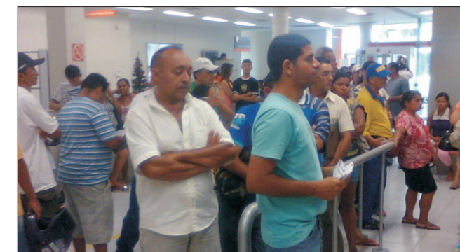
Filas nas agências do Itaú continuam enormes pela falta de funcionários