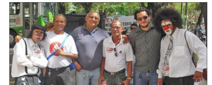
Bancários do BASA estão em greve desde o dia