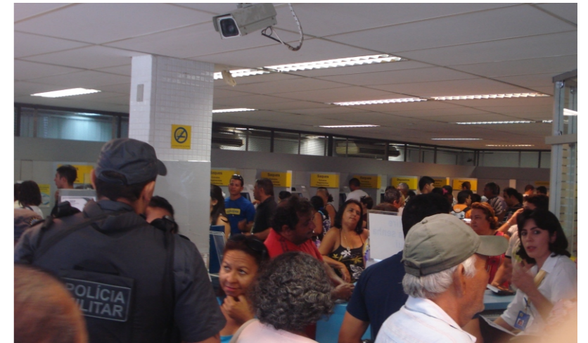
No BB Parnamirim muitos clientes para poucos funcionários.

O diretor orienta a desobediência de tal orientação porque não é isso que o Banco quer e, principalmente, ao procederem dessa forma os colegas estarão camuflando a necessidade de contratação de mais funcionários para que o BB preste um