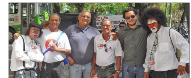
Bancários do BASA estão em greve desde o dia

Para fugir da negociação, o governo levou a greve para o TST e recusou a proposta feita pela Ministra Maria Cristina Peduzzi na audiência de conciliação para encerrar a greve, que foi considerada legal pelo tribunal. Os companheiros do BASA esperam agora o julgamento do dissídio, que ainda não foi marcado.