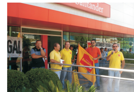
Na Prudente, Sindicato denunciou ilegalidade do Banco de Horas