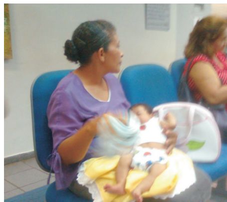
Cliente abana criança com frauda descartável

Agência Via Direta oferece serviço grátis de sauna para clientes e bancários