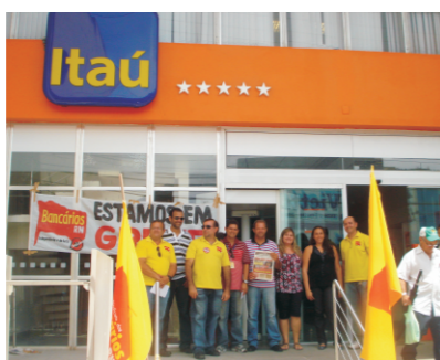
Manifestação fechou três agências