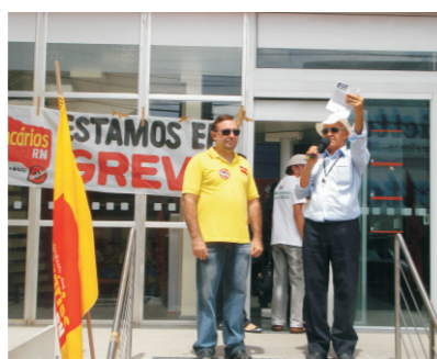
Aposentado prestou solidariedade ao ato