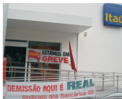
Bancários não trabalharam em protesto