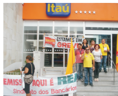
Diretoria não arredou pé das agências