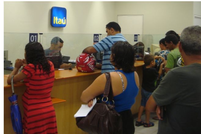
Procon estadual prometeu multar Bancos caso a lei 9.460/2010 não seja cumprida em 30 dias; sindicato cobrou atitude e vai fiscalizar cumprimento da lei